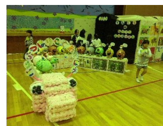
<ききょう・すみれ・たんぽぽ組>